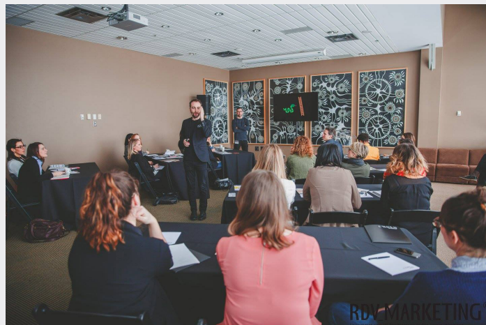
Zone master classes - Campus