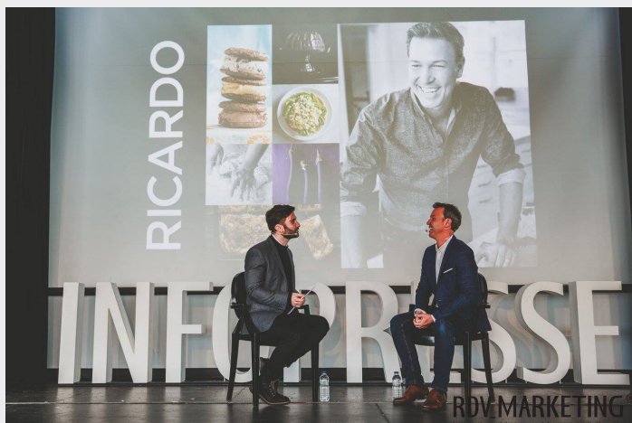
Salle plénière - conférences internationales

CONFÉRENCIERS INTERNATIONAUX PANELS • KIOSQUES 3 AXES DE CONTENU MARS 2018 DE 9H À 17H