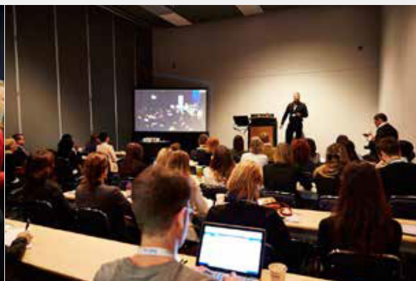
Zone master classes - Campus