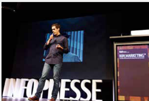
Salle plénière - conférences internationales

CONFÉRENCIERS INTERNATIONAUX DÉBATS • KIOSQUES 4 AXES DE CONTENU MARS 2016 DE 9H À 17H